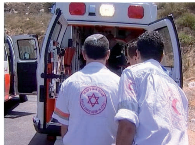
Trasferimento di un neonato dall'ambulanza palestinese a quella israeliana